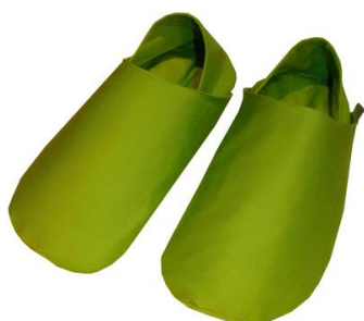
TOFFLOR S, M, L